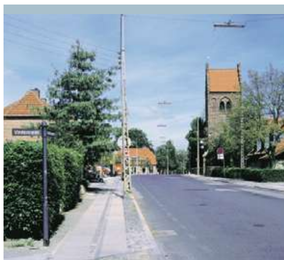
Gentofte Kirke ligger på Gentoftegades højeste punkt.

Den ældste bygning i Gentofte Kommune er Gentofte Kirke, som kan dateres tilbage til 1176. Siden er tilføjet tårn, kor, våbenhus og sideskib. Kirken står i røde teglsten som et gotisk bygningsværk. Det