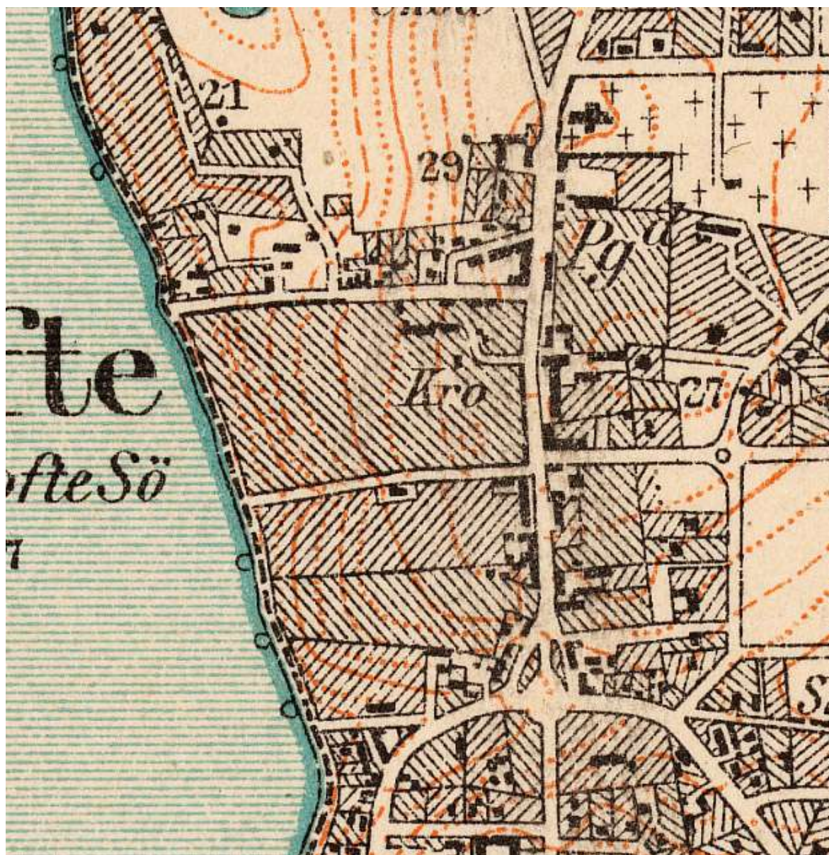
Historisk kort. Målt 1899 og rettet 1914.