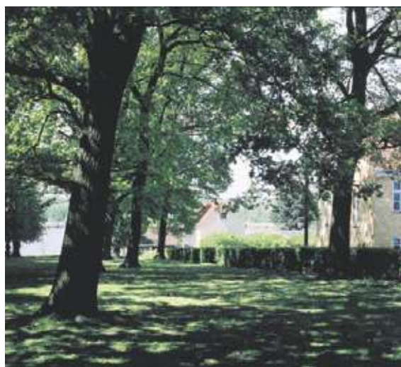
Solpletter i Kloekers Have

Efter udskiftningen i 1766 gik der kun 40 år, før den sidste gård var flyttet ud på marken. Der er kun få rester tilbage af landsbymiljøet, fx omkring Fiskebakken nede ved søen mod syd samt Mitchellsstræde